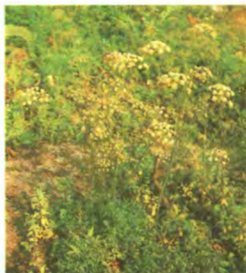
774. Смовдь гірська.